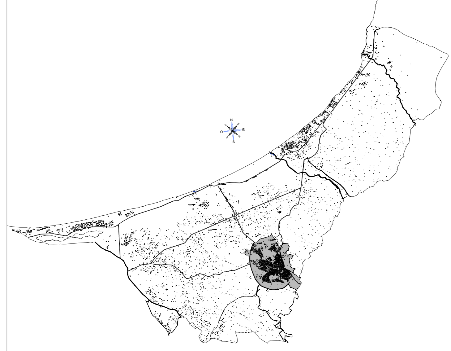
TAV. 4.4 CENTRO ABITATO

SERVIZIO DI SPAZZAMENTO MECCANIZZATO PROGRAMMAZIONE SETTIMANALE