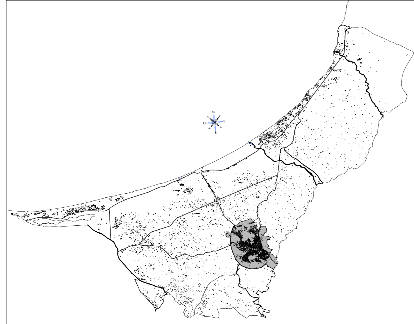
TAV. 1 CENTRO ABITATO

SERVIZIO DI SPAZZAMENTO MECCANIZZATO DOMENICALE